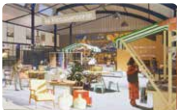
Représentation non contractuelle

Consultez le règlement de l'appel à candidature et téléchargez le dossier sur le site internet du SITOMAP : www.sitomap.fr